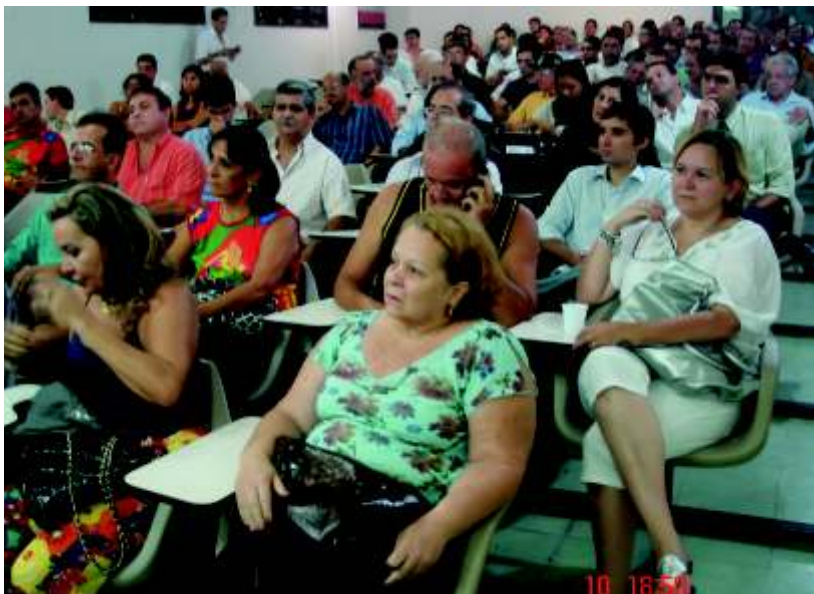
Categoria comparece em massa à Assembléia que elegeu a Comissão Eleitoral que vai conduzir o processo